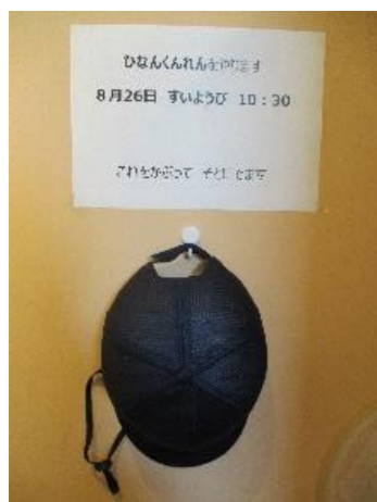
訓練前のおしらせ

皆さん、こんにちは！「スタジオアルテ」「NIHO アルテ」で行なっている避難訓練の流れをご紹介します！！ （自閉症支援でコンサルに入っている先生の指導を元に避難訓練を行なっています。）