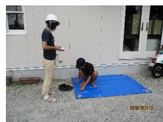
一対一での支援！避難完了1